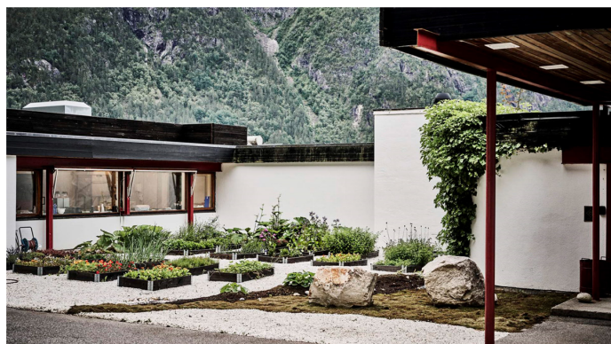
Prosjektet Verdifull arkitektur i Rogaland skal kartlegge, løfte fram og formidle felles kulturarv. Foto av Energiho-tellet på Nesflaten.

Stavanger arkitektforening har hatt et bredt spekter av faglige og sosiale arrangementer gjennom hele året. Det ble arrangert forelesninger med både nasjonale og internasjonale foredragsholdere, filmvisninger og omvisninger.