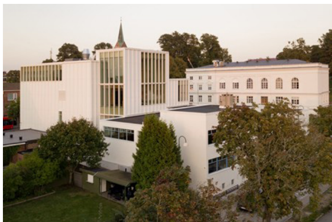
ØAFs Arnstein Arneberg-pris for 2025 gikk til Rodeo arkitekter og Plus arkitektur for nye Sarpsborg bibliotek. Foto: Rodeo arkitekter/Carlos Rollan

Østfold arkitektforening har hatt både faglige og sosiale arrangementer gjennom hele året. Aktivitetene har vært fordelt på både vår- og høstsemesteret, og har hatt som mål å tilby medlemmene faglig påfyll, nettverksbygging og uformelle treff.