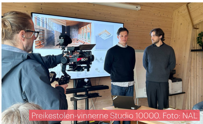
Preikestolen-vinnerne Studio 10000.

I mars var det generalforsamling, etterfulgt av faglig innlegg fra ACAN i april og et felles medlemsmøte med NLA samme måned. Høsten ble innledet med sommerfest i august, før det i september ble arrangert befaring til Tangenkaia. I oktober ble det gjennomført omvisning i Hel-separken, etterfulgt av faglig arrangement med Studio 10000 i november. Året ble avsluttet med juletreff.