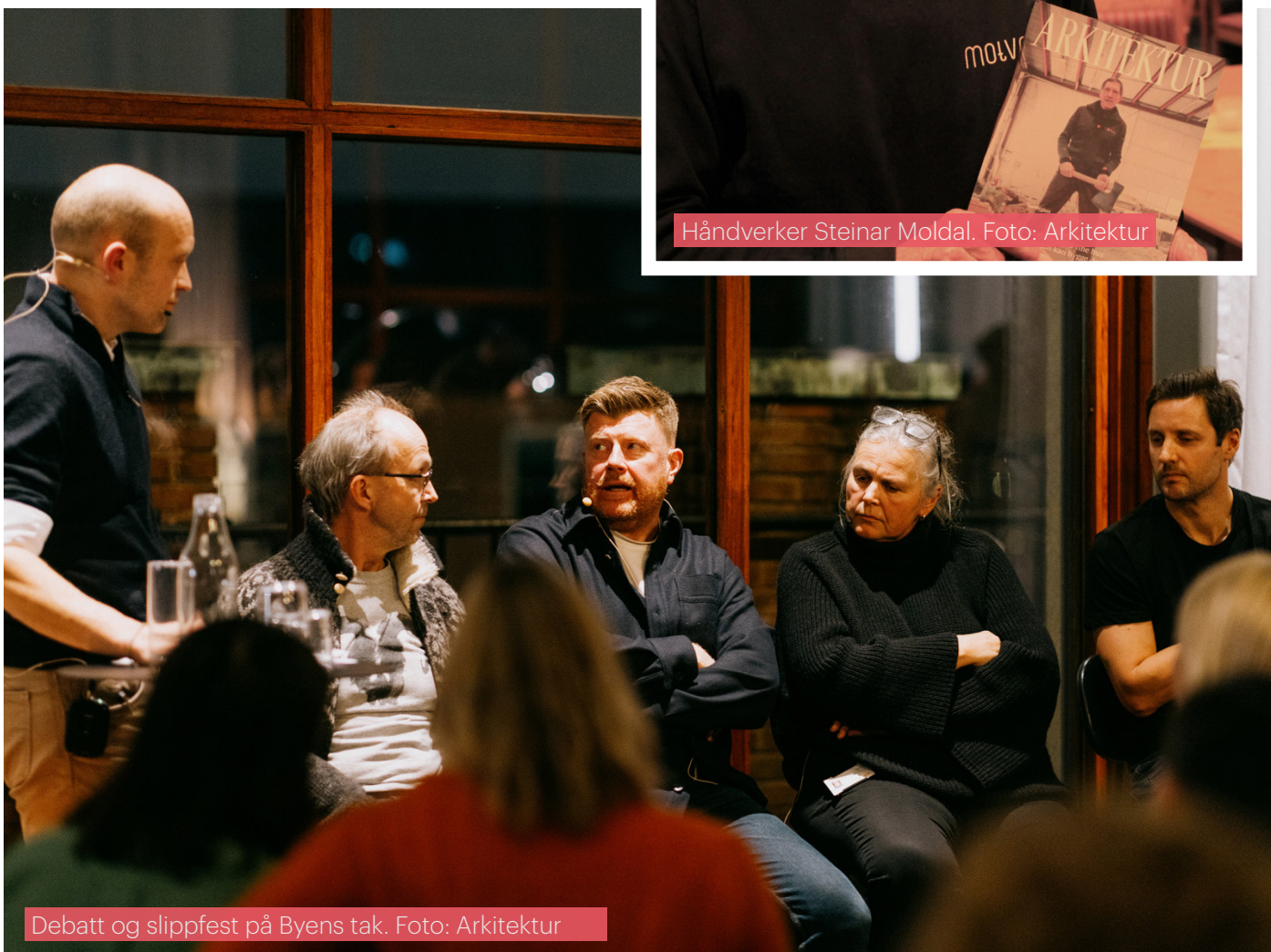
Debatt og slippfest på Byens tak.