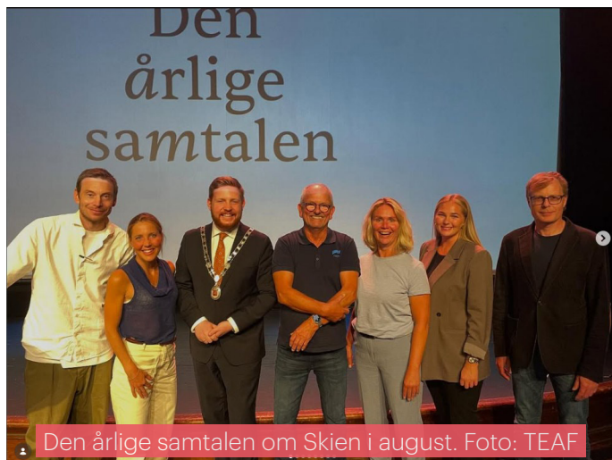
Den årlige samtalen om Skien i august.

Telemark arkitektforening har fått økt synlighet, samarbeid og faglig engasjement, til tross for krevende rammevilkår i byggebransjen. Foreningen har prioritert å styrke sin rolle som lokal faglig aktør gjennom dialog med kommuner, samarbeid med næringsliv og deltakelse i offentlige debatter.