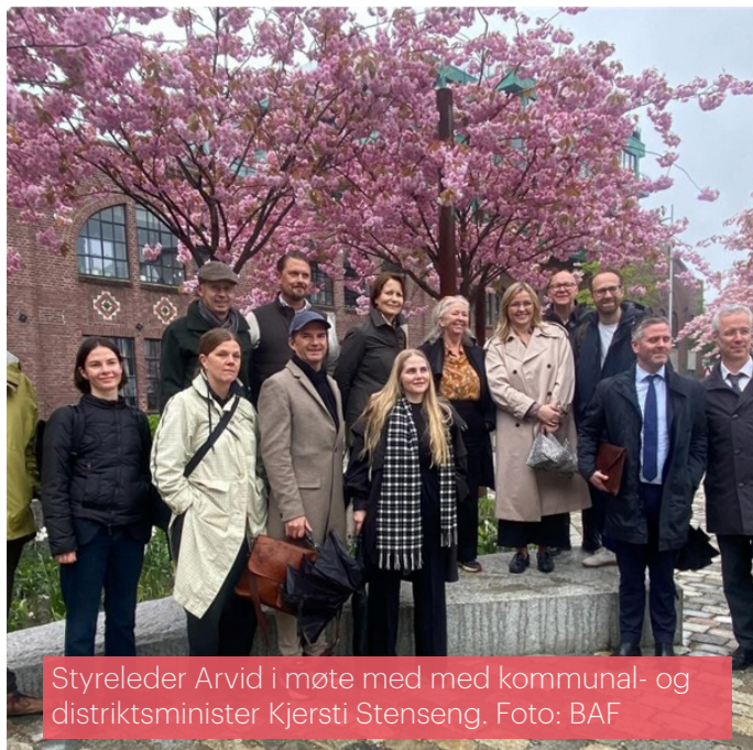
Styreleder Arvid i møte med med kommunal- og distriktsminister Kjersti Stenseng.

både fagmiljø og politikere. Det ble også gjennomført lansering av ny boligplan, som samlet aktører fra ulike deler av bransjen.