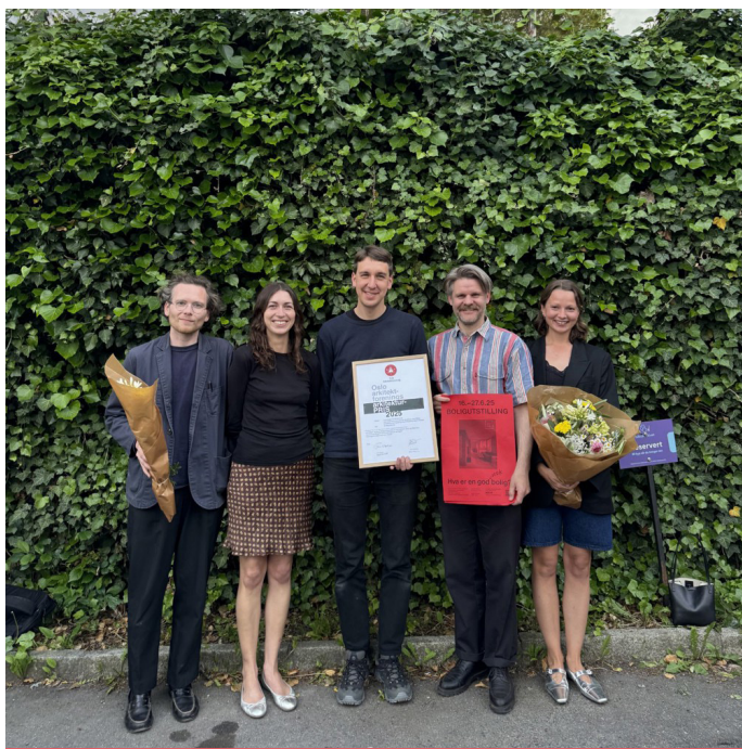
OAFs arkitekturpris gikk til Ny boligplan. Prisen ble utdelt på sommerfesten.

Samlet sett har foreningen styrket rollen som en sentral møteplass for faglig diskusjon, kunnskapsdeling og arkitekturpolitisk engasjement.